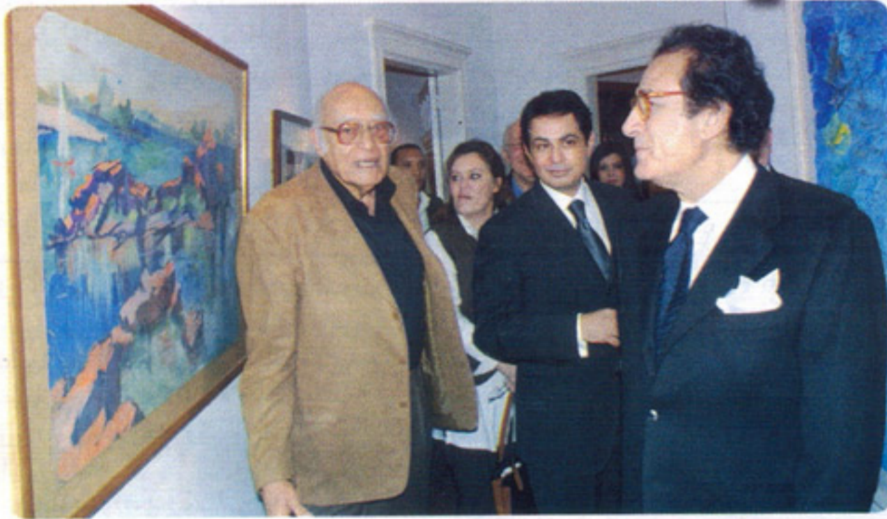
الفنانان فاروق حسنى وطه حسين

●● وعنه كتب الناقد الكبير والمفكر بدر الدين ابوغازي، «التجربة والتجديد من سمات الفنان طه حسين فهو صاحب جسارة من التصور وجرأة في معالجة التشكيل الفني وفق الأساليب والاتجاهات الحديثة حيث صاحب القيادات الفنية المعاصرة وأمن مثل اتباع «الباو هاوس» بارتباط الفن الحياة والمجتمع والتقاء التصميمات الفنية بالصناعة.. للفن في رؤية وحدة وللتشكيل فيما تتبدى في العمارة والتصوير والنحت كما تظهر في