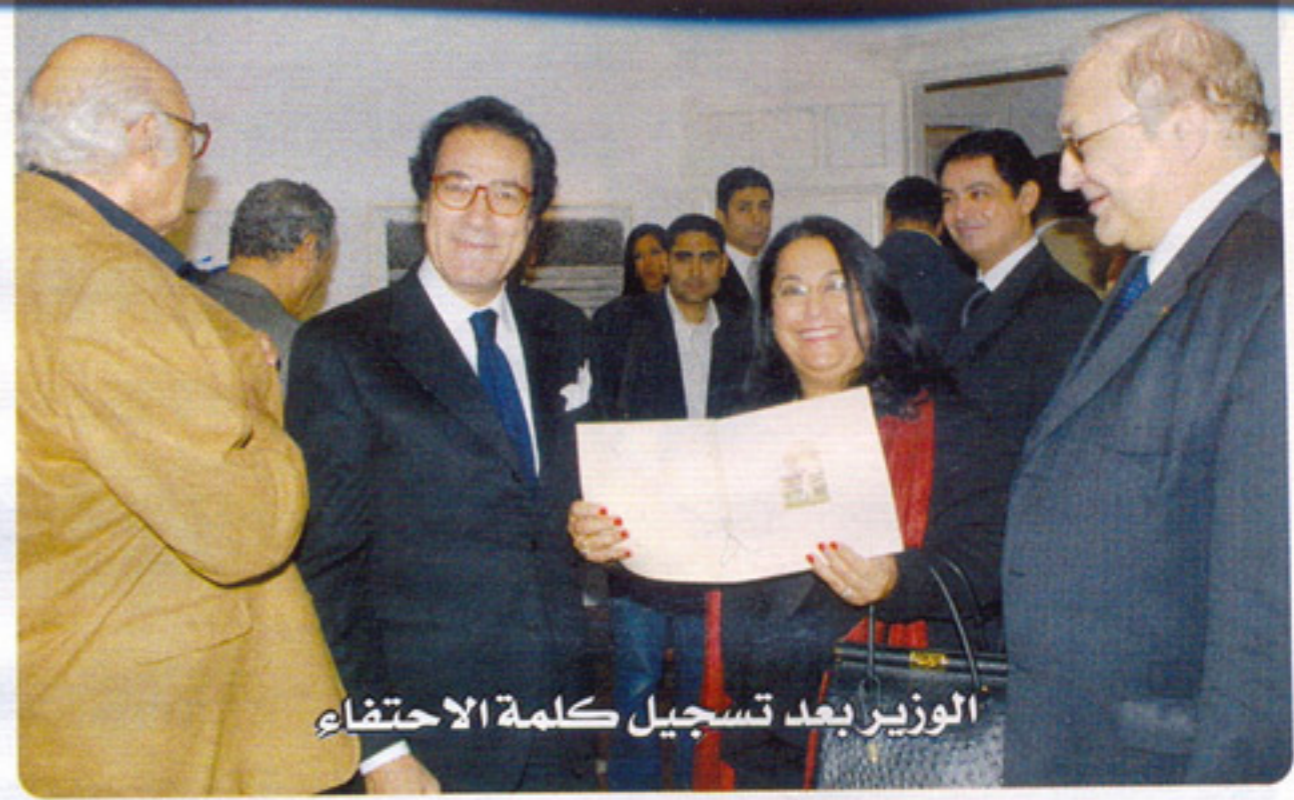
الوزير بعد تسجيل كلمة الاحتفاء