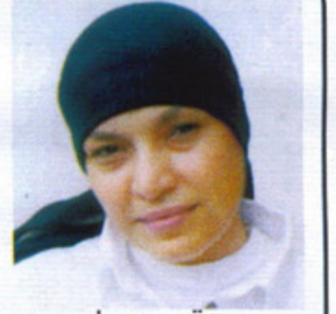
تقدمها فاطمة علي

رغم احتفال جاليري «المسار» برؤية واعداد مدير الجاليري وليد عبدالخالق بإقامة معرض ضخم للفنان الكبير طه حسين بمناسبة بلوغه سن الثمانين (أطال الله في عمره وابداعاته) إلا انه بدأ كاحتفال الحركة التشكيلية المصرية جميعها بهذا الفنان - العلامة المؤثرة في حركة التشكيل المصري - وذلك بحضور وزير الثقافة الفنان الكبير فاروق حسنى ومئات من فناني وتلاميذ ونقاد ومتذوقي فن طه حسين وبحضور رئيس قطاع الفنون التشكيلية الفنان محسن شعلان في تجمع فني متميز داخل قاعات الجاليري وسط عزف كلاسيكيات موسيقية لتفتتح بها هذه الاحتفالية التي تستمر شهرا كاملا.