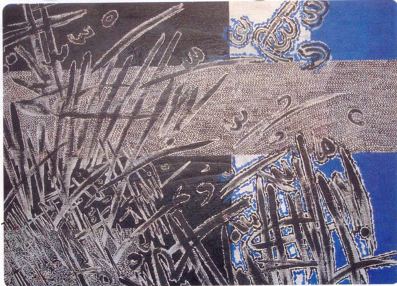
لوحات تعبر عن مراحل من مشواره الفنى خلال ستين عاما

بهذه التجربة وكذلك بطول سنوات مشروعه الفنى.. فالفنان طه حسين كما نعرف جميعا هو رفاق فى عمله الفنى مبتكر دائماً.. مفاجيء.. ونشعر به دائما من خلال خفه لانه انسان على وعى كامل بكل مقدرات عمله الفنى.. نحتفى به لانه احد أعمدة الفن التشكيلى فى مصر وهو خبير فى هذا المجال».