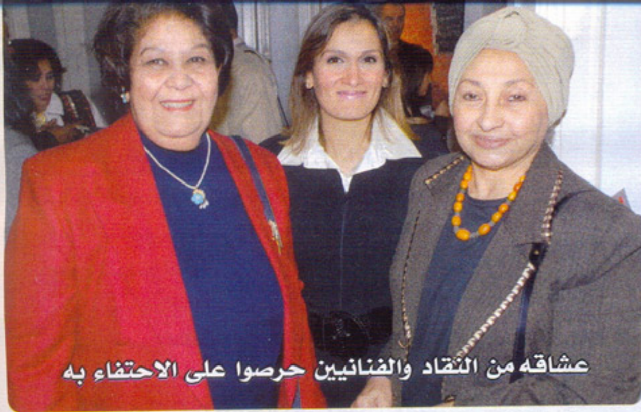
عشاقه من النقاد والضائين حرصوا على الاحتفاء به