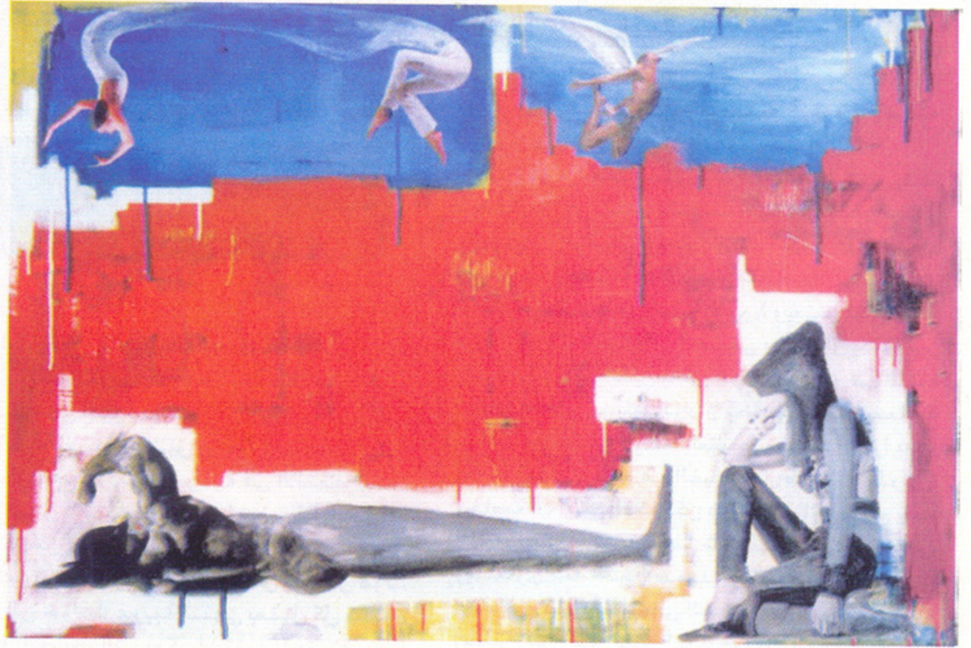
«أنوبيس» و«الباتمان» للفنان خالد حافظ