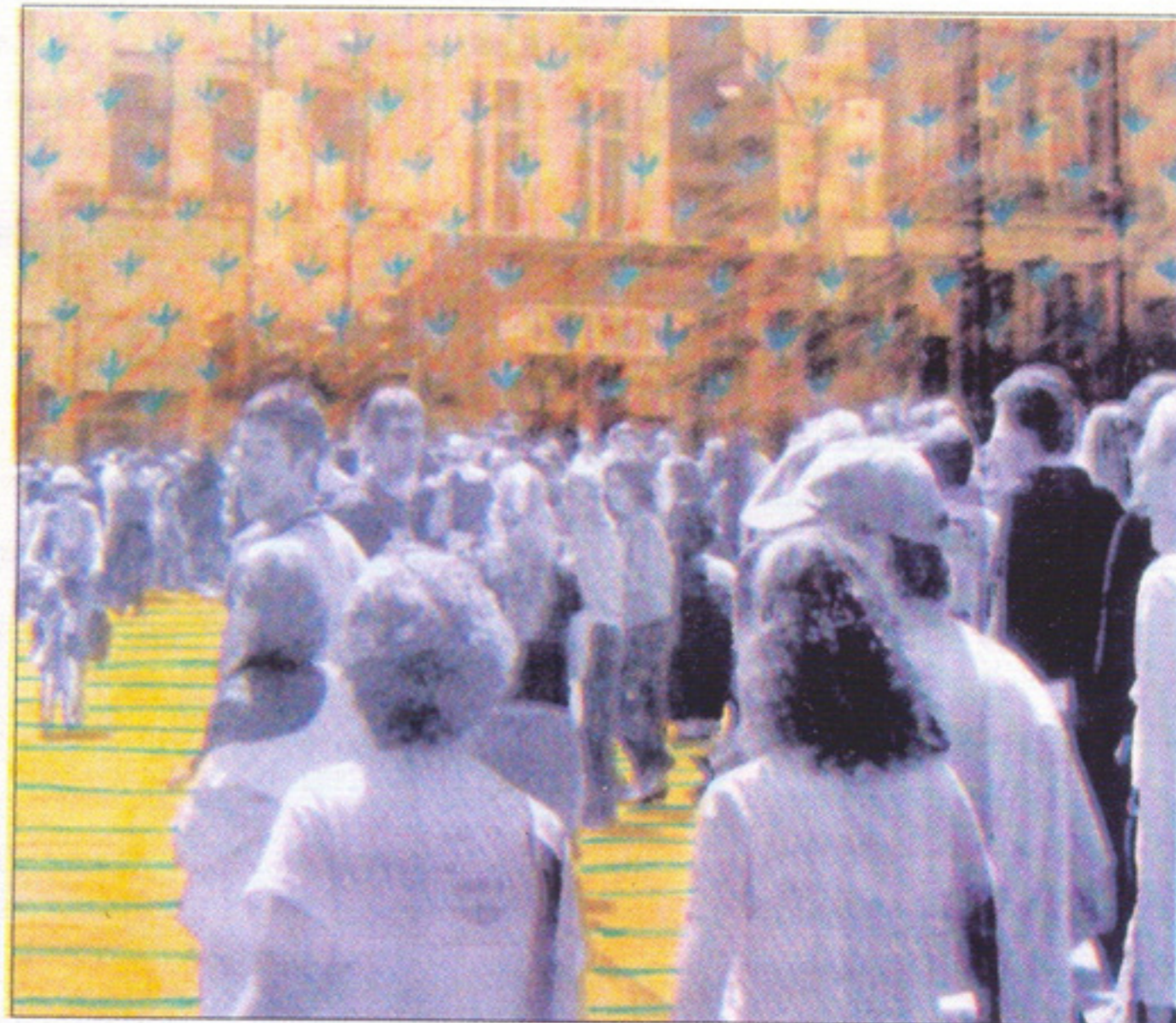
مشهد من بريطانيا للفنانة صباح نعيم