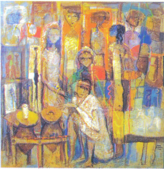
تصوير زيتى للفنان عمر النجدى مستوحاه من التراث الشعبى